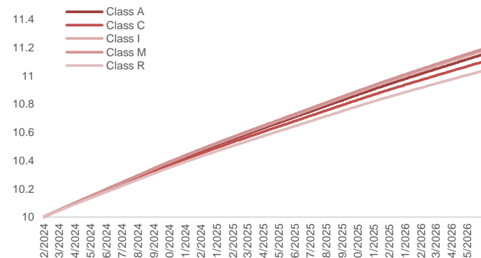
數據來源: 招銀國際資產管理有限公司。截止2026年5月29日